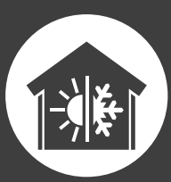
GEVEL / EPS